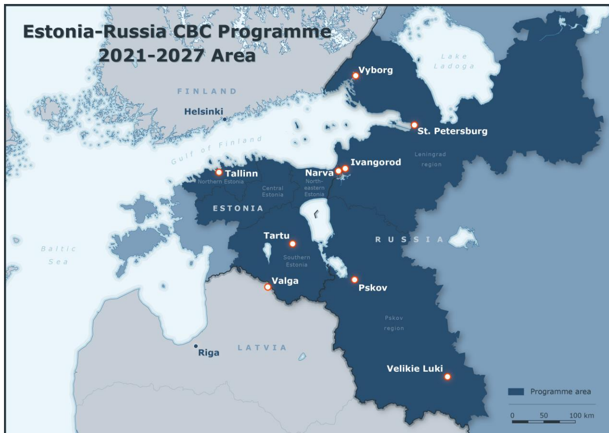
Eesti-Vene piiriülese koostöö programmi 2021-2027 ala kaart

Käesolev uudiskiri on valminud Eesti - Vene piiriülese koostöö programmi 2014-2020 rahalise abiga. Antud väljaande sisu eest vastutab programmi ühine tehniline sekretariaat ning selles kajastatu ei peegelda programmi liikmesriikide ega Euroopa Liidu seisukohti.