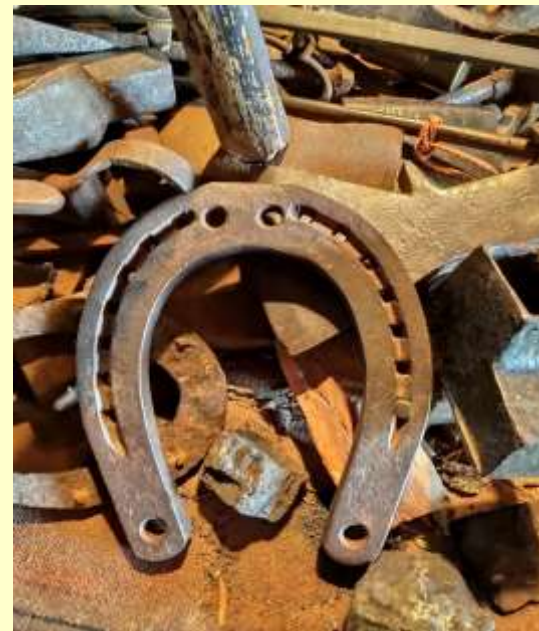
Palmse mõisa sepikoda

Uus turunduse / messi infrastruktuur laiendab väikeste ja keskmise suurusega ettevõtete võimalusi oma tooteid turustada ja müüa.