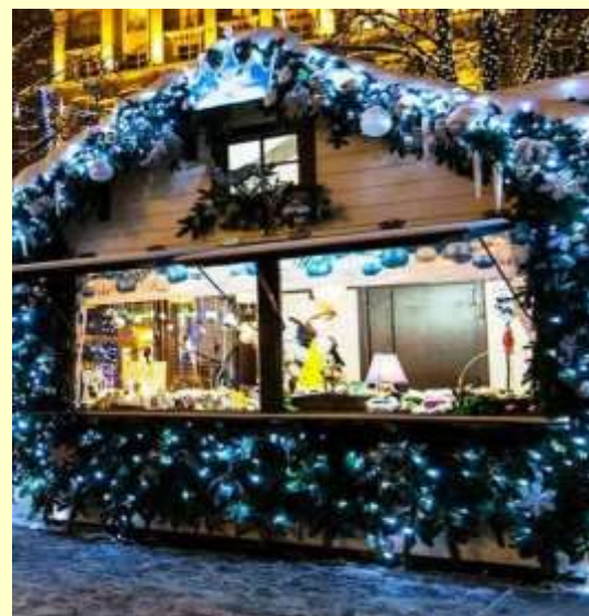
Ярмарочные домики https://pkgreenwood.ru/yarmarochnyy-domik-novozodny/

Новая инфраструктура маркетинговых мероприятий/ ярмарок расширит возможности для малых и средних предприятий по маркетингу и продаже своей продукции.